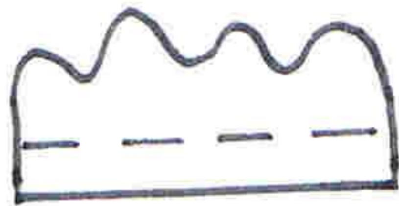
Kamm für das Küken

gestrichelte Linien knicken und anleben;