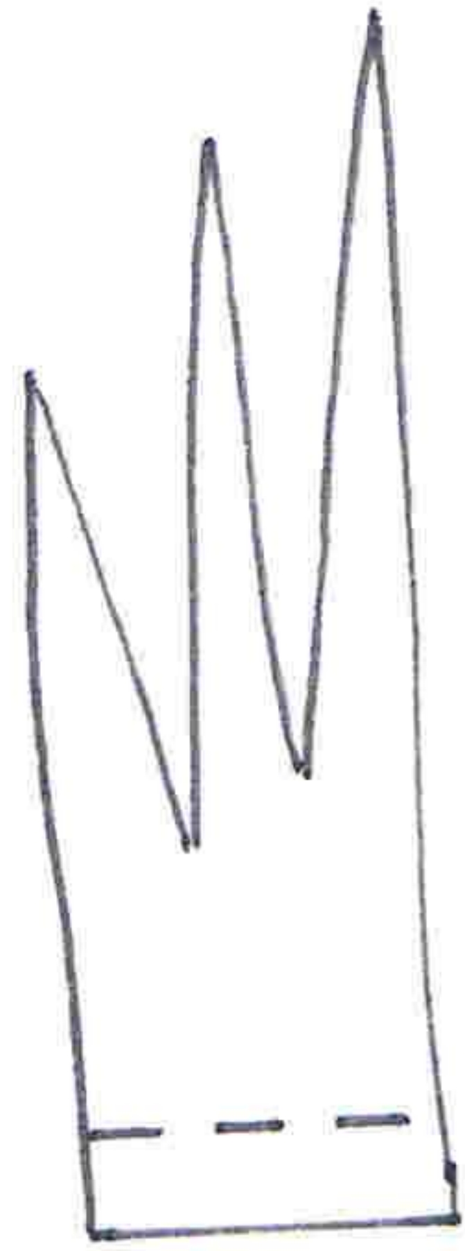
Kamm für den Hahn