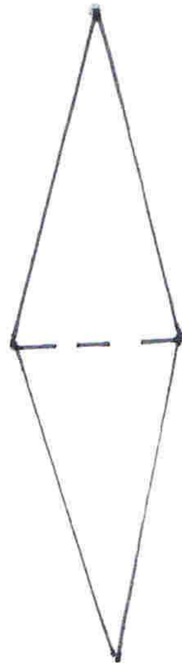
Schnabel für den Hahn

gestrichelte Linien knicken und anleben;